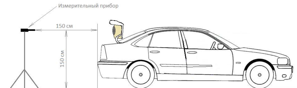
Рисунок 3. Расположение измерительного оборудования во время замеров классов «Тыл».

В классах «Тыл STREET, 1 и 2» микрофон для замера SPL, с помощью специального приспособления, располагается позади транспортного средства на расстоянии 150 см от вертикальной воображаемой линии проходящей перпендикулярно от земли к самой крайней точке кузова автомобиля или аудиосистемы и направлен в сторону багажника (как показано на рисунке 3).